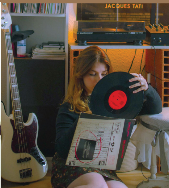
The girl from Tutu

La musique et le spectacle vivant sont à l'honneur à l'occasion de la réouverture de la médiathèque ! Profitez-en aussi pour découvrir nos collections consacrées à la musique et aux arts, et prenez le temps d'une pause dans le salon d'écoute.