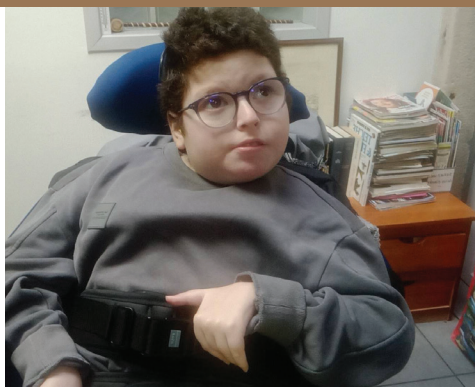
Yoen - Au-delà du sommet