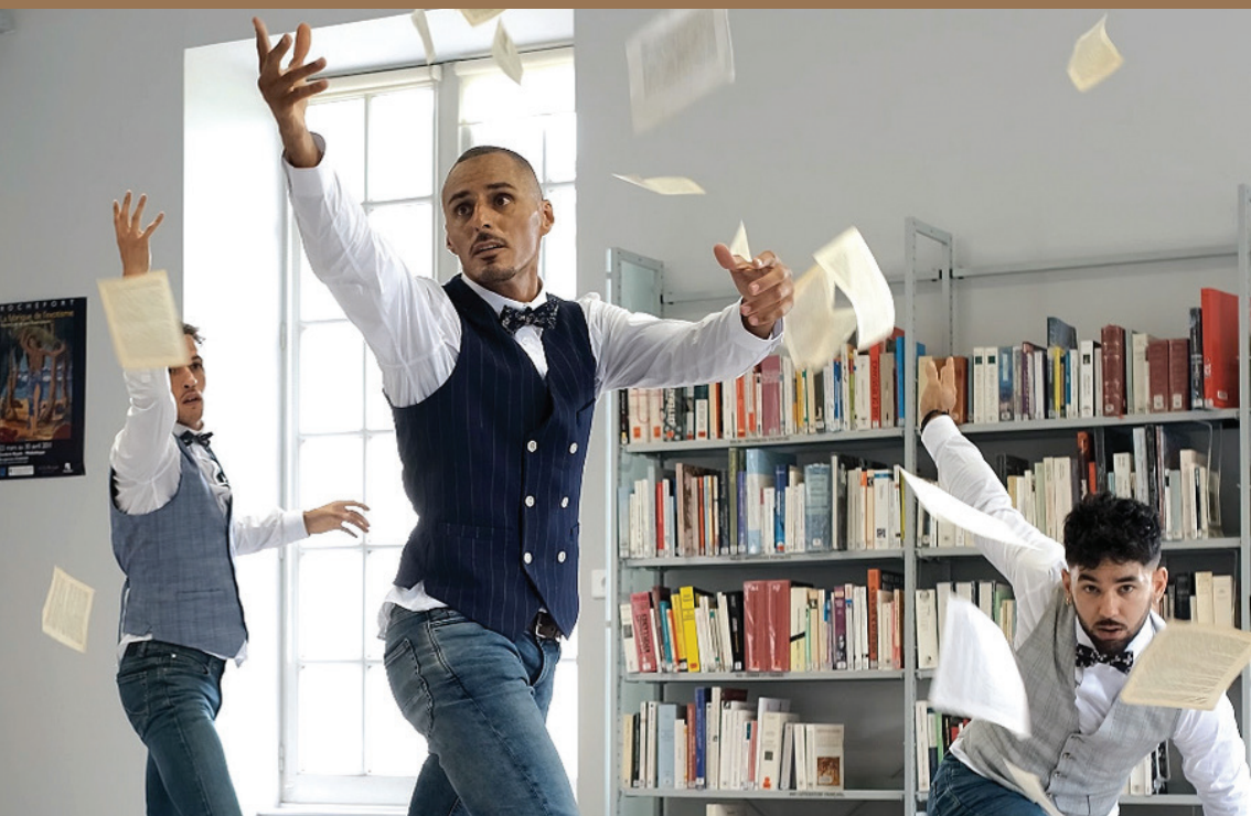
Danse avec les livres