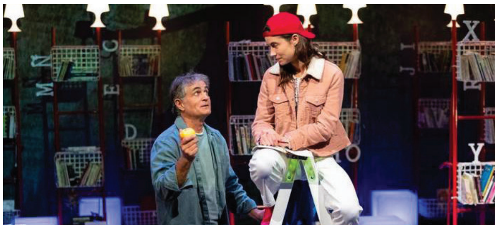
Mundua pitzatuta dago... | Ttanttaka teatroa