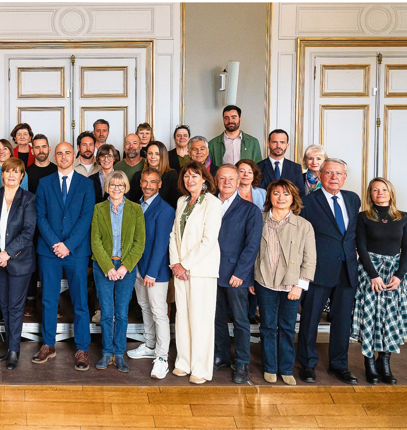
L'équipe municipale réunie le 28 mars dernier dans le Grand Salon de l'Hôtel de Ville