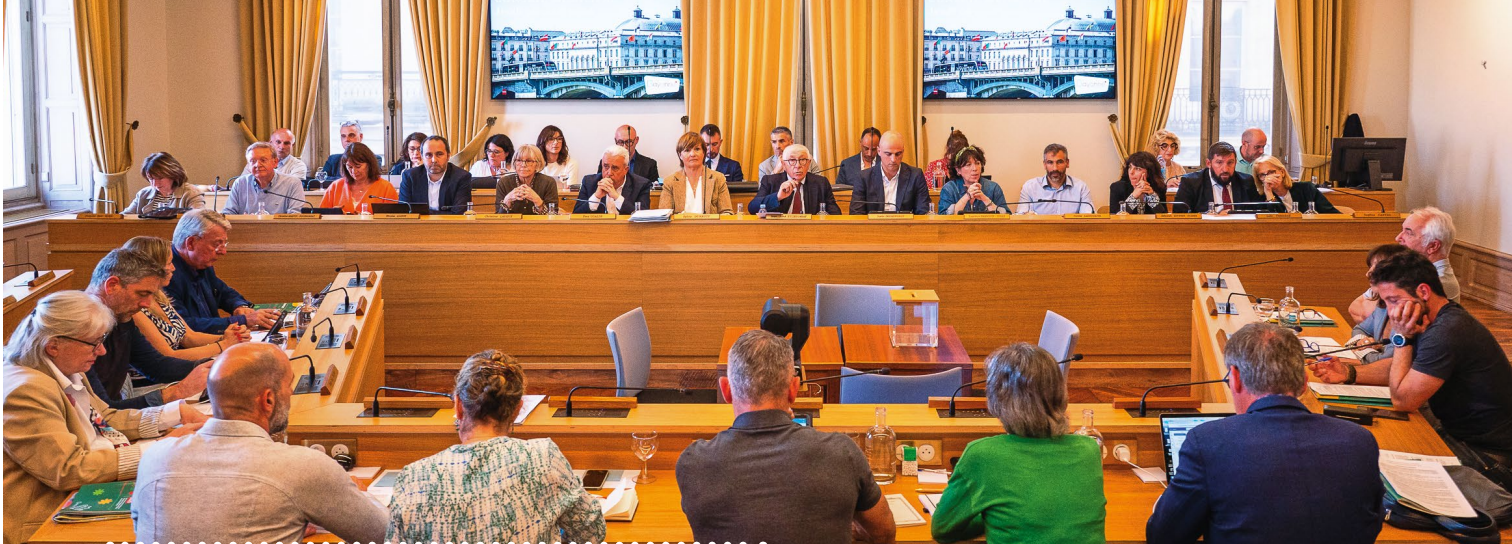
Le 9 avril, le conseil municipal a élu les membres des différentes instances